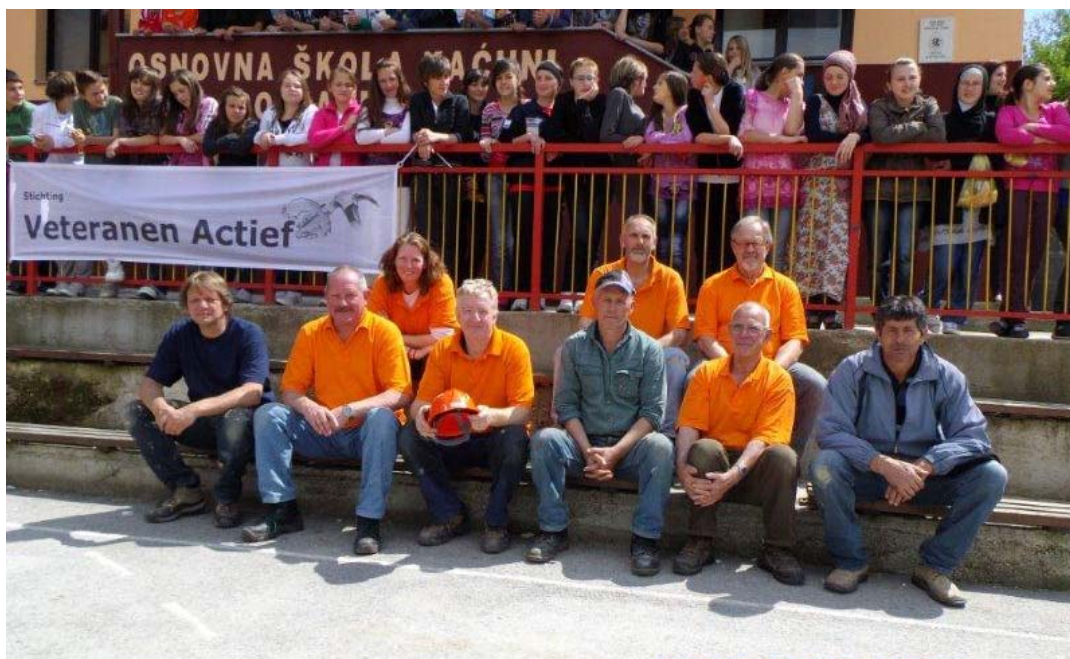
Katici mei 2012