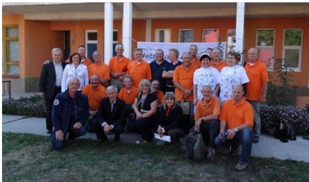
Novi Travnik september 2012

Onze vrijwilligers zijn tot zeer veel in staat, zeker in samenwerking met Bosnische veteranen en de lokale bevolking! Uw steun is echter onontbeerlijk voor het goede werk wat deze mannen en vrouwen gezamenlijk tot stand brengen en zo onze doelstelling verwezenlijken.